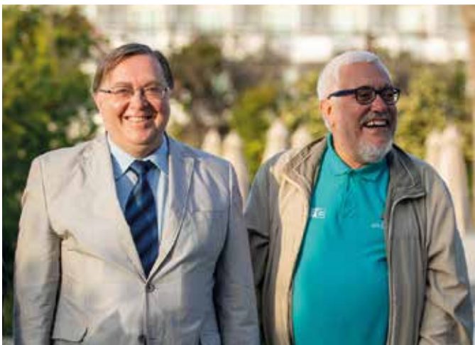
GM Zigurds Lanka (links) und GM Spyridon Skembris (rechts)

Video GM Skembris (Langversion) https://youtu.be/pfiaZhygb4w