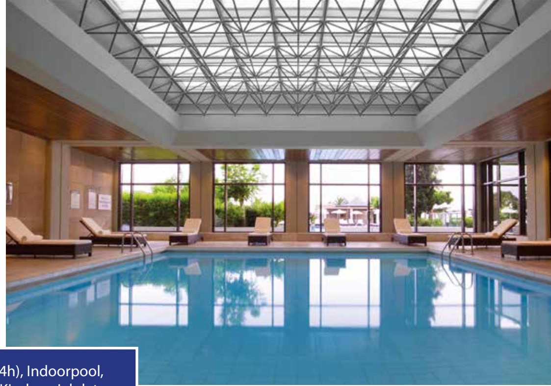
Fitnesscenter (24h), Indoorpool, Squash und ein Kinderspielplatz stehen kostenlos zur Verfügung